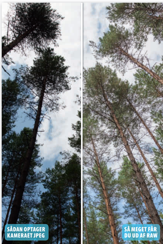
Da billedet er skudt i raw, kan man hente masser af detaljer i skyggerne med et meget bedre resultat end med jpeg.

Nu går vi i gang med en helt ny kursusrække, hvor vi hjælper dig med at konvertere raw-filer, der i billedbehandlingen kan justeres med meget bedre resultat end jpeg. De funktioner, vi viser, kan bruges på alle dine egne filer med samme problem. Vi viser, hvordan du løser problemet i henholdsvis Elements, Photoshop og Lightroom, og her i første afsnit af Raw-skolen kan du se, hvordan du hiver masser af detaljer frem i skyggeområderne. ■