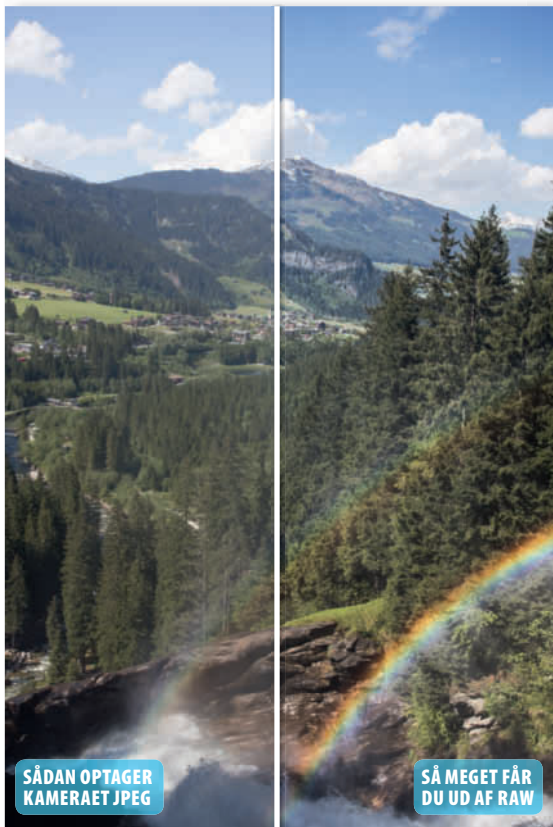
Kontrasten er forbedret betydeligt i billedet, uden at det er gået ud over de mørkeste og lyseste områder.

Når man retter kontrasten i et foto, tager man normalt fat i billedets yderpunkter og gør de lyseste områder lysere og de mørkeste mørkere, men der sker nemt dét, at store dele af billedet bliver helt hvide og helt sorte, så de er uden nuancer. I raw-konverteringen kan man forbedre kontrasten og stadig sørge for detaljer i yderområderne, og her kan du se, hvordan du sikrer nuancerne i henholdsvis Elements, Photoshop og Lightroom. ■