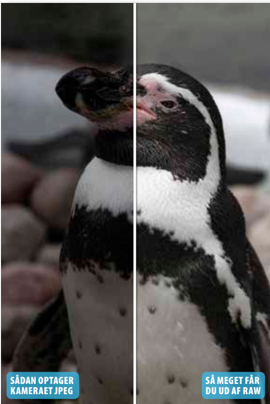
Højlysene er lysnet, og nu træder billedets detaljer tydeligt frem, uden at det er gået ud over kontrasten.

Når man justerer lysforholdene i et billede, kan man risikere at gøre kontrasten svagere. I raw-konverteringen kan man forbedre lysforholdene markant og samtidig sikre en høj kontrast i billedet. I kurset her viser vi, hvordan man ved at justere eksponering og højlys i billedet får et flot og velbelyst resultat. Her kan du se, hvordan du sikrer billedets lysforhold i de tre billedbehandlingsprogrammer Elements, Photoshop og Lightroom.