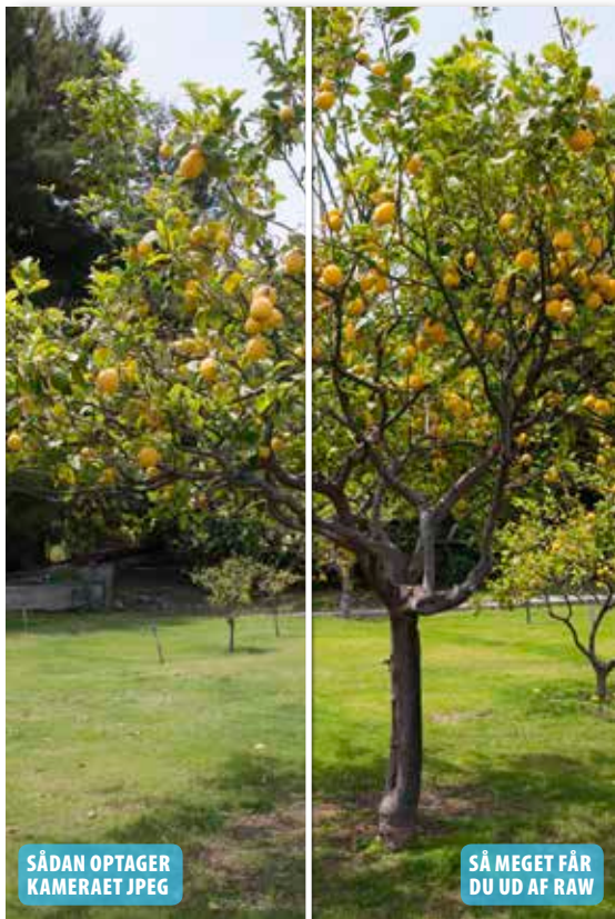
Farverne fremstår mættede og indbydende, hvilket i kombination med en høj kontrast giver billedet liv.

Farverne i den uberørte raw-fil kan justeres præcis, som du ønsker. Her kan du se, hvordan du med stor nøjagtighed kan sikre en vellykket farvemætning i de tre billedbehandlingsprogrammer Elements, Photoshop og Lightroom. Arbejder man med jpeg, får man ikke de samme muligheder for at justere både farvens styrke og mætning, som man gør i raw, hvilket giver varme og levende farver, der samtidig fremstår naturlige. ■