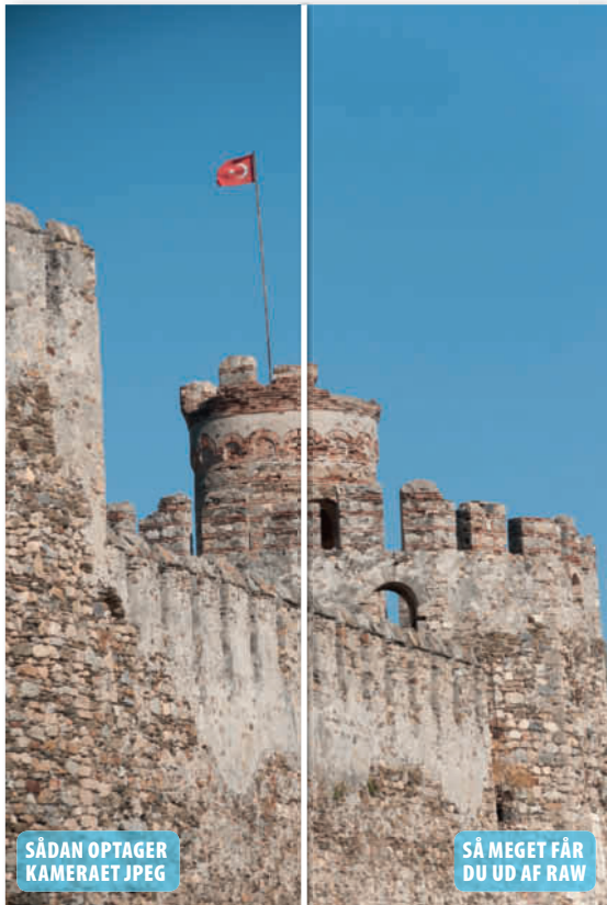
De mørke billedhjørner er især tydelige på motiver med en lys baggrund, som fx en himmel.

Mørke billedhjørner og skæve linjer samt violette farver i kontrastrege områder hører til de udbredte fejl, man som fotograf må slås med. Her er det en klar fordel, hvis man skyder i raw. Adobes raw-konverter byder nemlig på en yderst effektiv funktion, der med et snuptag kan rette op på fejlene. Desværre kan raw-konverteren i Elements ikke rette fejlene, men derfor kan de godt rettes, når man sender billedet videre fra raw-konverteren. ■