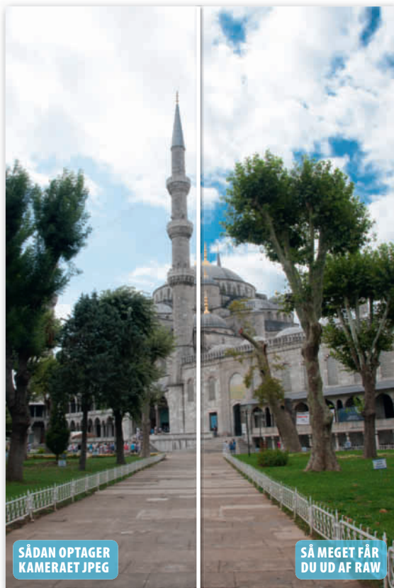
Farverne er justeret individuelt, så himlen fremstår mere blå, mens græs og træer har fået en flottere grøn nuance.

Når man skyder i raw, får man adgang til den ultimative billedredigering i raw-konverteren. Det gælder ikke mindst justering af farvenuancer, hvor man i Photoshop CC og Lightroom kan justere i de enkelte farvekanaler uden at påvirke de andre farver i billedet. På den måde kan man fx nøjes med at forstærke den blå farve i en himmel. Raw-konverteren i Elements er lidt mere simpel, men her kan farverne justeres efter raw-konvertering. ■