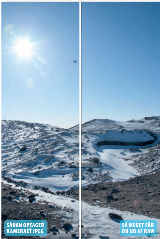
SÅDAN OPTAGER KAMERAET JPEG

Når der er kommet støv på sensoren, kan det have meget tydelige konsekvenser for billedkvaliteten. I de fleste tilfælde kan man dog rette op på det med værktøj som Spot Healing Brush. Har man skudt i raw og bruger Photoshop CC eller Lightroom, kan man tilmed gøre dette allerede i raw-konverteringen. Det giver en langt renere kloning af de omkringliggende pixels – ikke mindst hvis der er vigtige detaljer, som skal bevares. ■