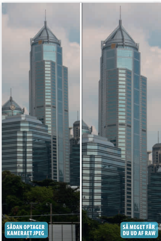
Den forstyrrende forgrund med kabler og stolper er skåret væk, og bygningen er nu blevet helt lige.

Når det skal gå stærkt, er der ikke altid tid til at finde et sted, hvor man får en perfekt komposition, og i skyndingen kan man holde kameraet lidt skævt. Med en beskæring kan man rette op og sikre, at kun det relevante vises. Ofte er det kun et lille forstyrrende element, som skal fjernes, før mesterskuddet er hjemme. I raw-konverteren får du hjælp til komposition med både hjælpelinjer, vaterpas og de mest gængse billedformater. ■